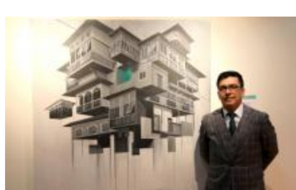
'Crónicas verdes' y 'Génesis 1996', las ganadoras del Salón Nacional de Pintura

Todo estaba listo para construir una primera muestra -esperan que esta sea el inicio de muchas-, y llegó la pandemia. "Aplazamos y nos replanteamos. Primero hicimos un banco de preguntas que les pasamos por correo, después realizamos entrevistas por Zoom y luego visitamos los talleres", explica Jaramillo.